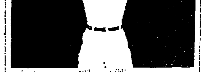
لطف من البهرة (رويترز)